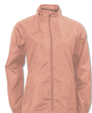
CHUBASQUERO MUJER JOMA GALIA SALMON