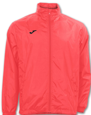
CHUBASQUERO HOMBRE JOMA IRIS CORAL FLUOR

Bolsa del corredor Habrá chubasquero conmemorativa/ticket paella para todos los participantes de la prueba de 7K/senderistas y aquellos obsequios que la organización pueda conseguir para rellenar la bolsa del corredor. Resto categorías camiseta conmemorativa/ticket paella y aquellos obsequios que la organización pueda conseguir.